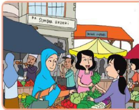
Kegiatan jual beli di pasar