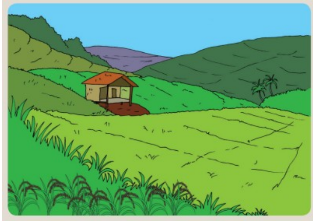
Gambar 1. Lingkungan yang bersih dan hijau

Lingkungan di sekitar kita ada yang terjaga dengan baik dan ada yang mengalami kerusakan.