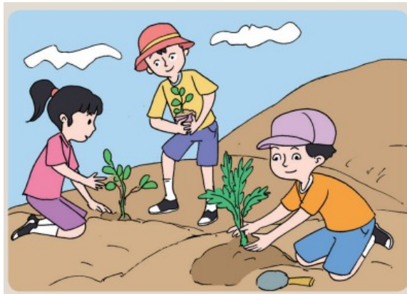
Gambar 2. Lingkungan yang mengalami kerusakan.