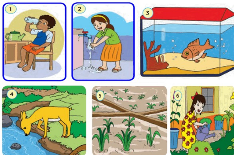
Gambar 3. Manfaat air bagi kehidupan