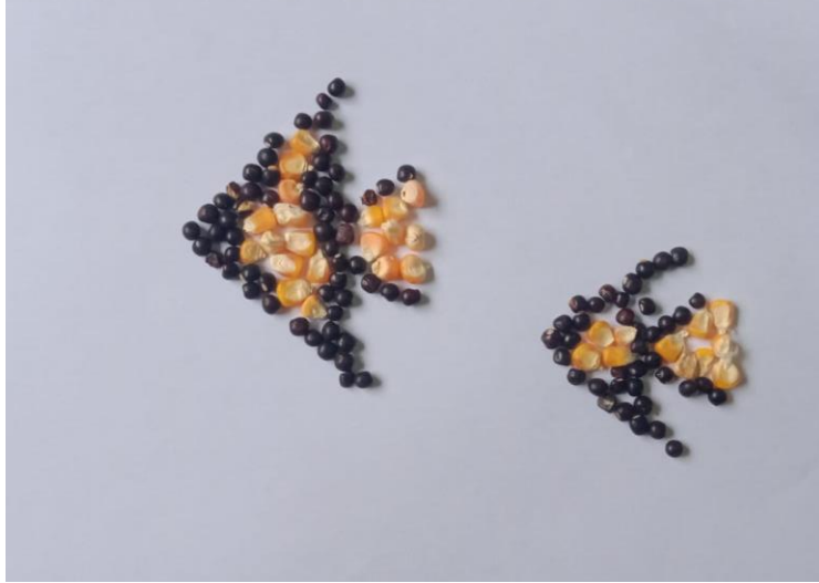
KOLASE BENTUK IKAN