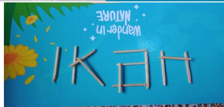
MEMBUAT KATA IKAN DARI BERBAGAI MEDIA