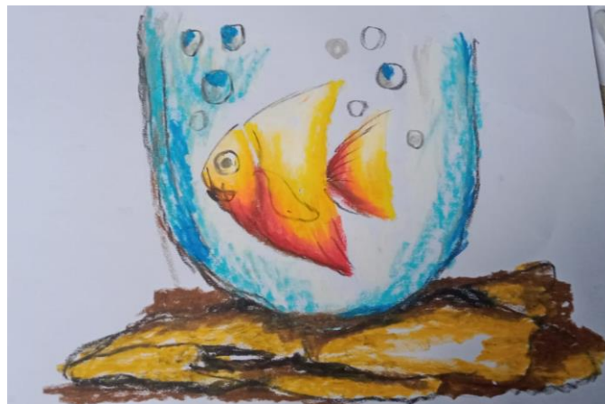
MENGGAMBAR IKAN DI AQUARIUM