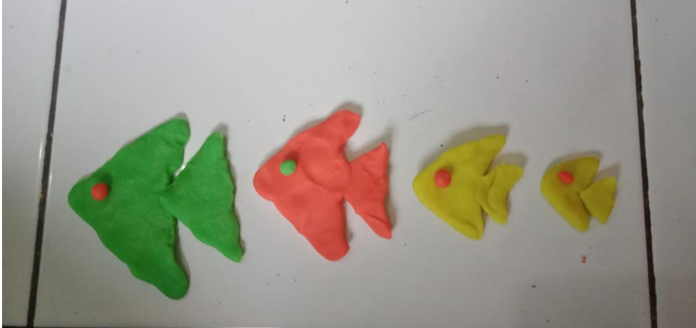
MENGURUTKAN IKAN DARI UKURAN BESAR KE LEBIH KECIL