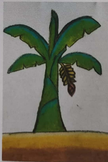
MENGGAMBAR POHON PISANG