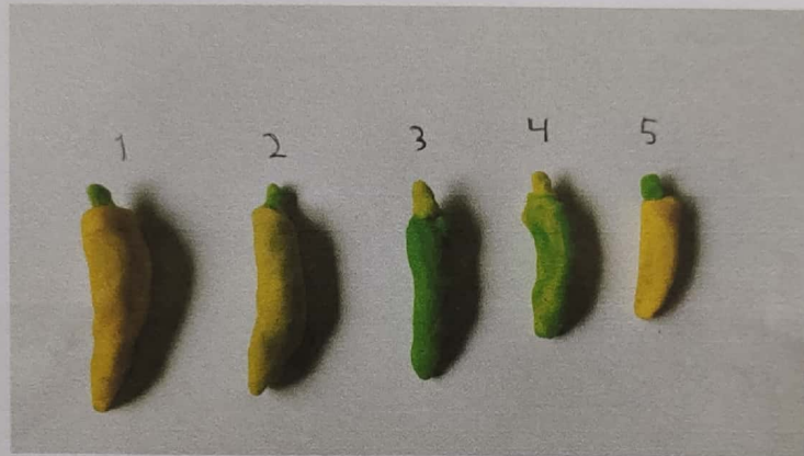
MEMBENTUK PISANG DARI PLASTISIN DAN MEMBUAT URUTAN DARI PALING BESAR KE YANG LEBIH KECIL