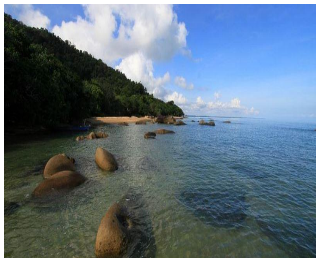
Tanjung Datu Beach