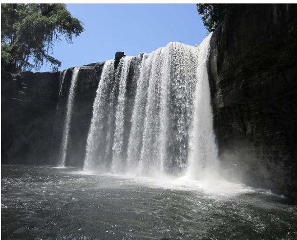
Riam Merasap Waterfall