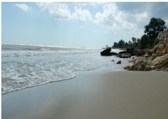
Tanjung Kemuning Beach