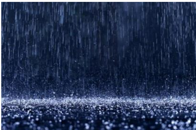
Gambar Cara Menghadapi Musim Hujan