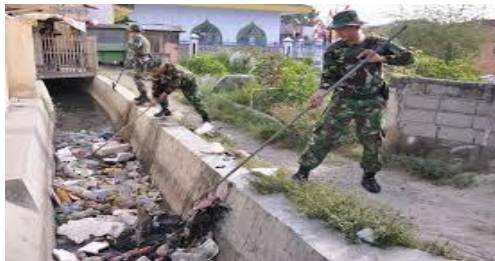
Membersihkan Sampah di Selokan