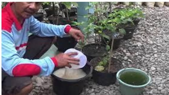
Menyiram tanaman menggunakan air beras