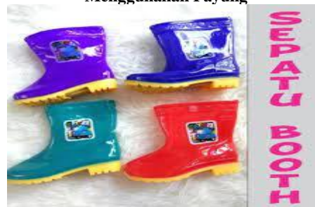
Menggunakan Sepatu Booth