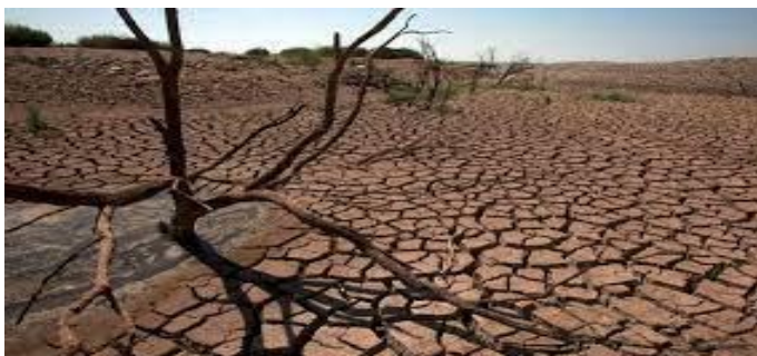
Gambar menghadapi musim kemarau