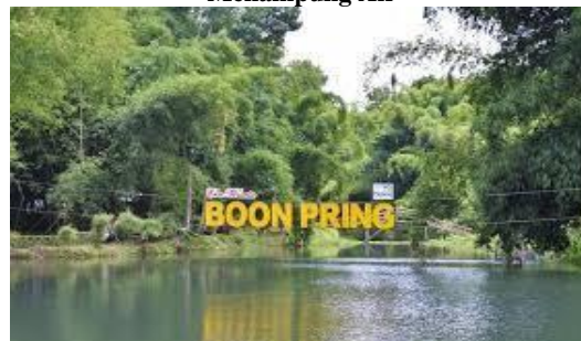
Membuat Hutan Bambu