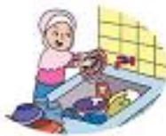
Mematikan keran saat menyabuni piring.