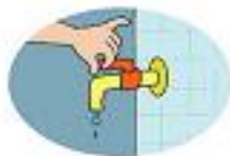
Setelah digunakan, keran air ditutup dengan rapat.