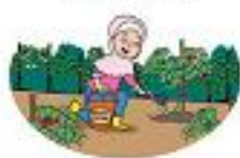
Menaburkan kompos daun di sekitar tanaman. Kompos akan menyimpan air lebih lama.