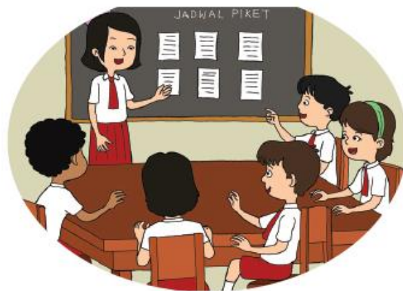
Pembagian Jadwal Piket Kelas