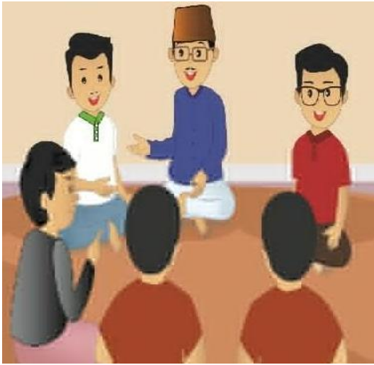
Musyawarah menentukan jadwal ronda malam