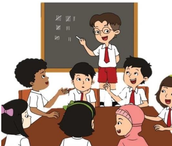
Pemilihan Ketua Kelas