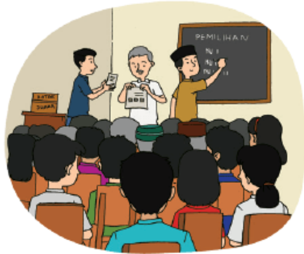
Pemilihan Ketua RT/ RW