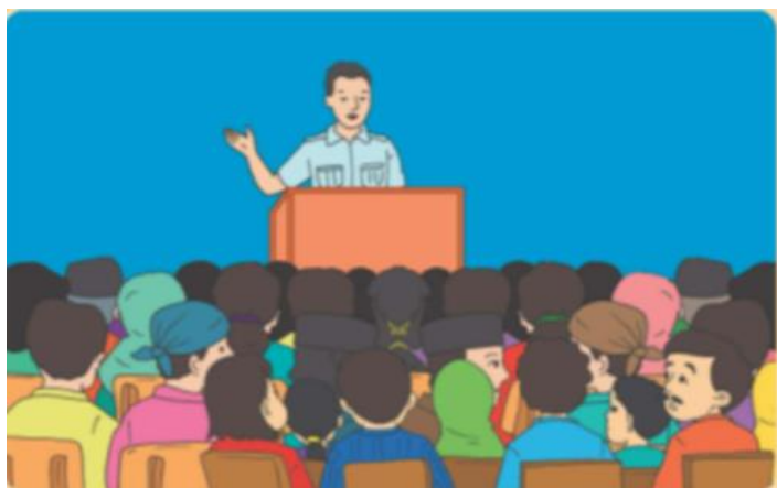
Gb3. Menyampaikan pidato