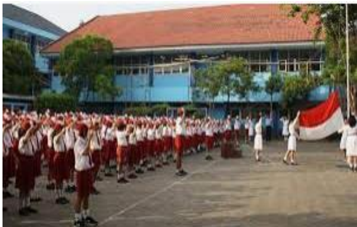
Gb2. Kegiatan menjadi pemimpin upacara