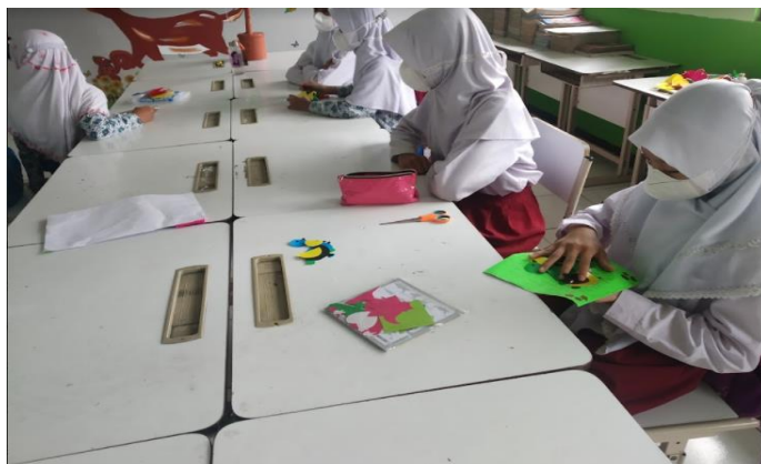
Gb1. Kegiatan menjadi pemimpin dalam kelompok belajar

Kegiatan yang berkaitan dengan peran seorang pemimpin