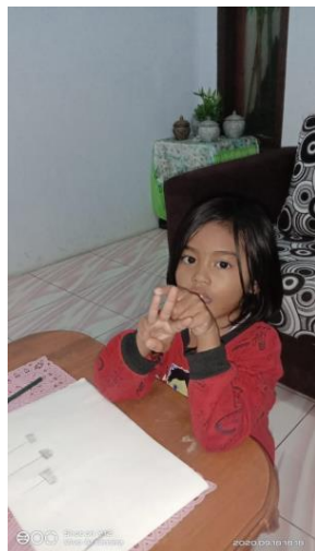
Foto kegiatan membilang gambar peralatan profesi yang dibuat