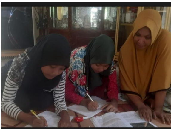
students learn from home during the pandemic