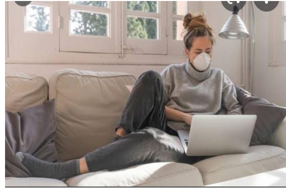
Work at home but still have to wear masks