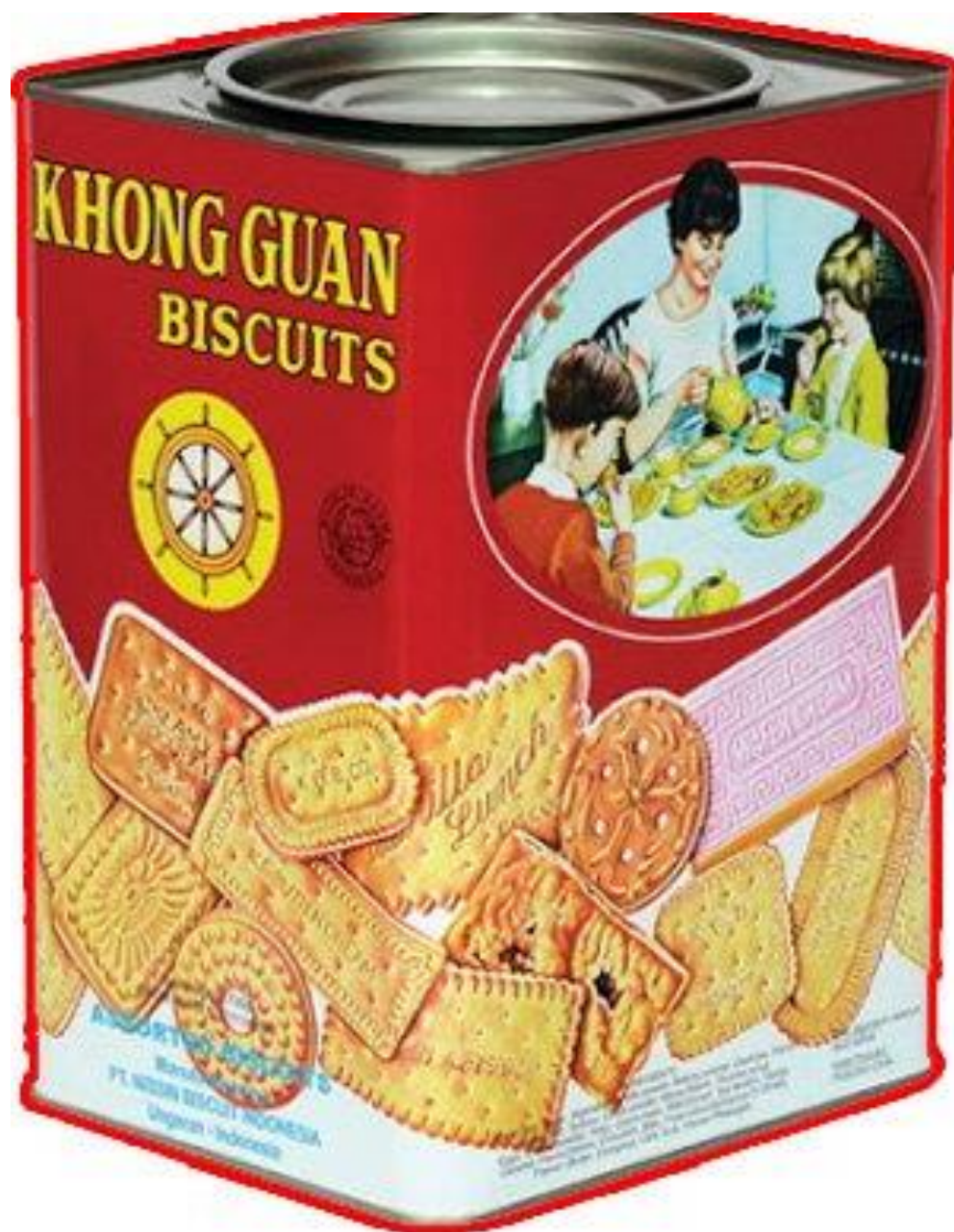
Kemasan Kaleng Logam