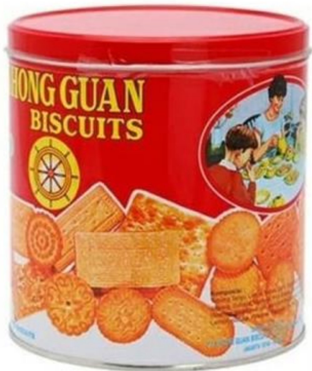
Kemasan Kaleng Logam