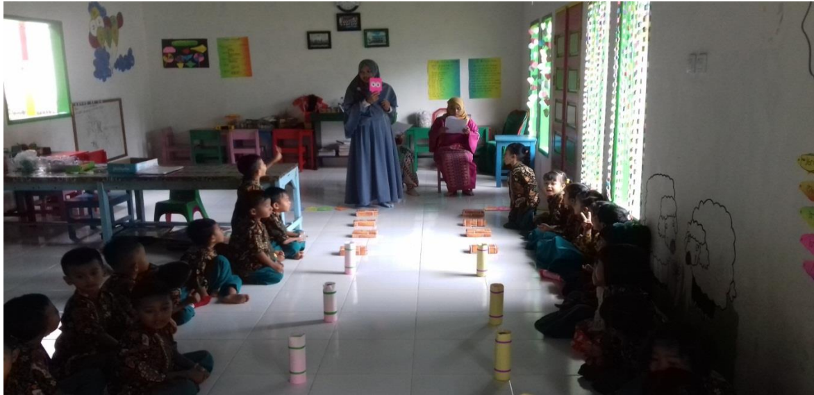
Guru mengenalkan media bermain