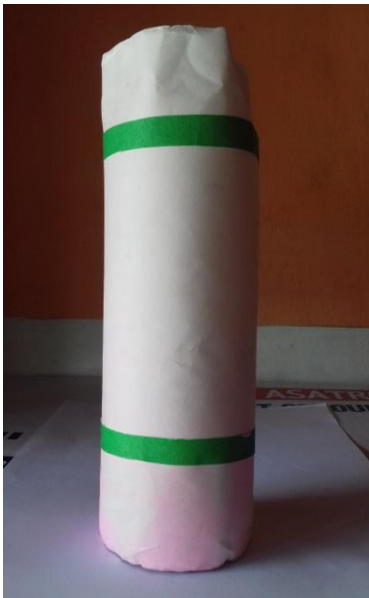
Botol minuman bekas