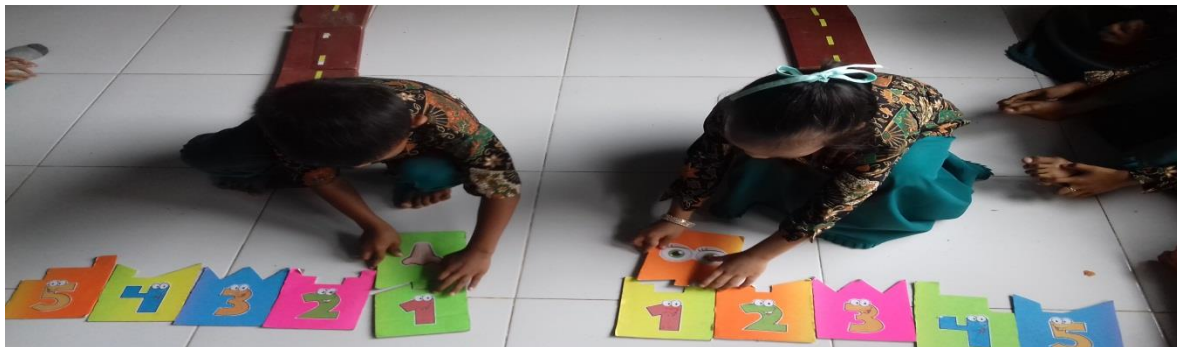
Siswa mencoba permainan Pecel Ayam Terasi (Permainan Cepat Menyusun Puzzle Aman, Nyaman, Terasik Dan Inovasi)