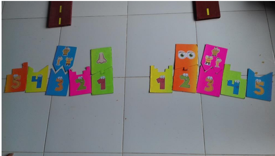
Puzzle angka sederhana