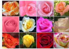
Hibiscus rosa-sinensis (mawar)

Variasi atau perbedaan gen yang terjadi dalam suatu jenis atau spesies makhluk hidup.