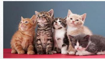
Felis catus (Kucing)