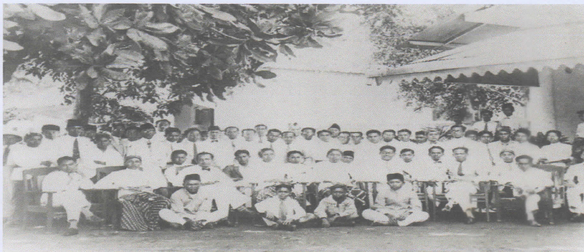
Suasana Sumpah pemuda