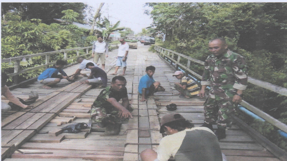
TNI dan rakyat Bersatu dan bekersama memperbaiki jembatan