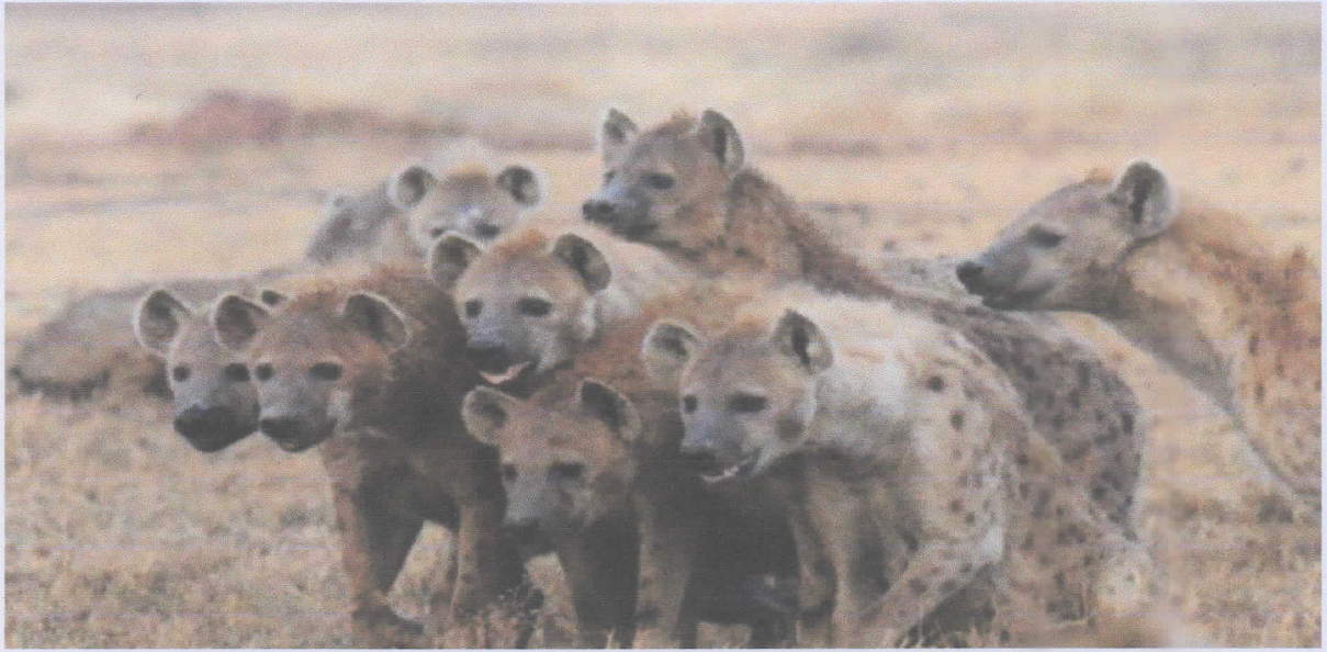
Heyna bersatu mempertahankan wilayahnya dan berburu mangsa