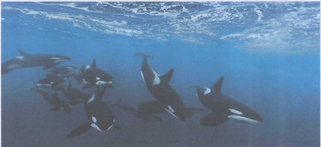
Paus pembunuh bersatu dan bekerjasama saat berburu mangsa