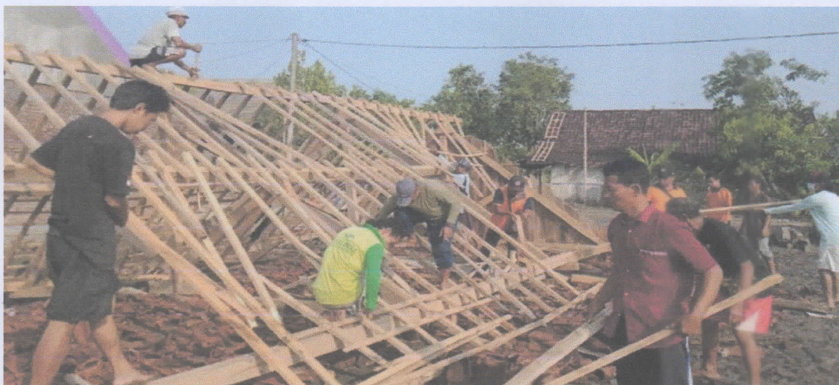
Bersatu dan bekerjasama membangun rumah