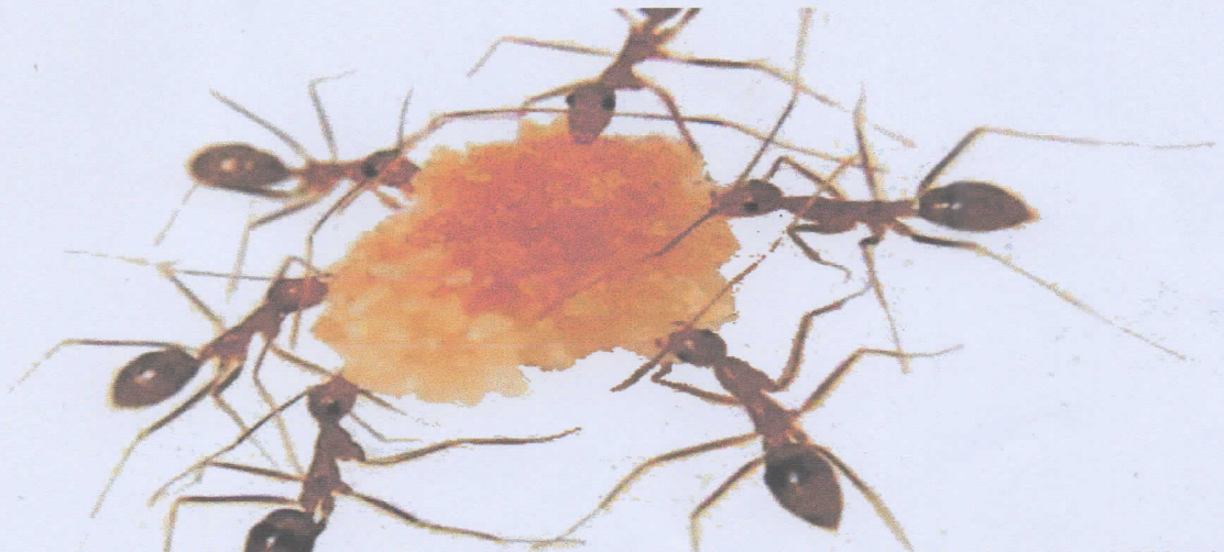
Semut Bersatu mengangkat beban berupa makanan