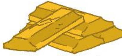
Emas 24 Karat