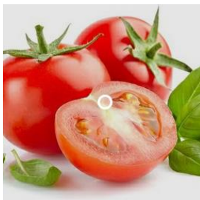
3 gambar buah tomat