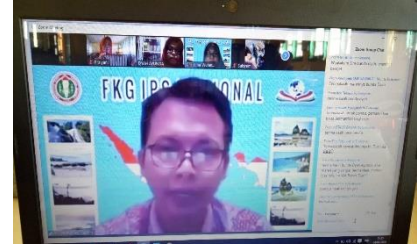
Photo Interaksi Sosial

Dalam kehidupan sehari – hari kita tidak bisa lepas dari Interaksi, baik interaksi orang perorangan, interaksi individu dengan kelompok maupun kelompok dengan kelompok. Sebelum adanya pandemi covid 19 interaksi dapat dilakukan secara normal.