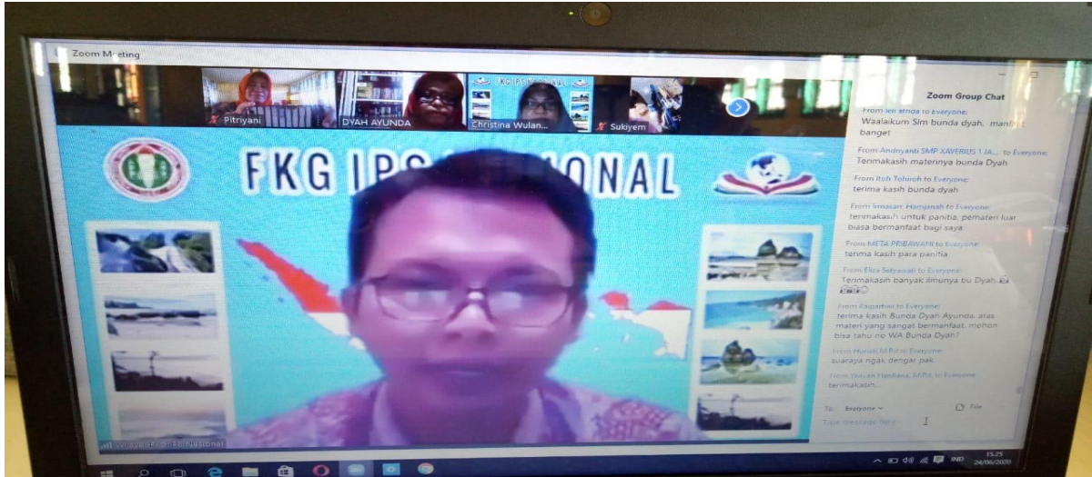
Pitriyani ( Hari Pertama )