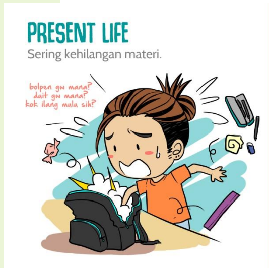
Gambar 5 Keadaan panik ketika kehilangan barang