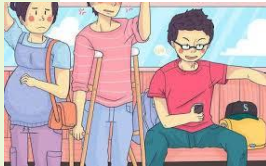
Gambar 6 Seseorang yang membiarkan ibu hamil dan disabilitas berdiri di kendaraan umum