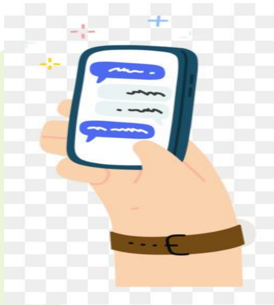
Gambar 4 gawai