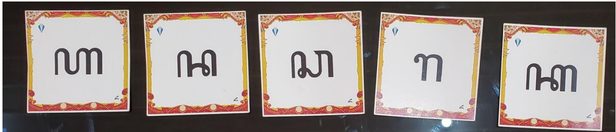
Kartu Aksara Jawa Nglegena