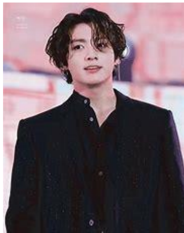
Jeon Jong Geok

Jungkook is the youngest member of the recent popular Korean boyband group member BTS. His birthname is Jeon Jung Kook. Today he wants to be called JK. He was born on September 1th, 1997 in Busan, South Korea. He is the Main Vocalist, Lead Dancer, Sub Rapper, Center/ Face of the Group.