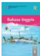
Source : Buku Siswa Edisi Revisi 2017 Bahasa Inggris kelas X SMA Kemdikbud 2017

Literasi ICT Kolaborasi Kemandirian Kerjasama Berpikir kritis