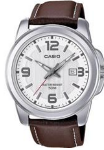
It's a watch = sebuah jam