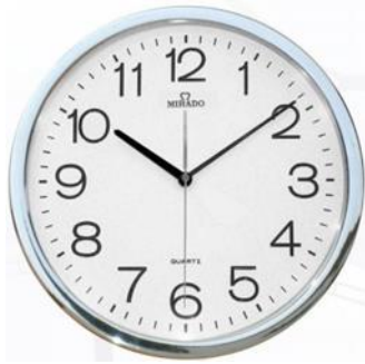
It's a clock = sebuah jam dinding tangan