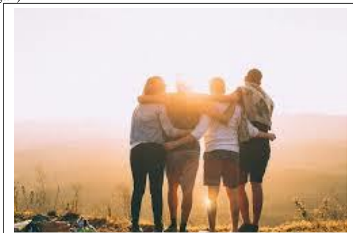
Gambar tanpa caption yang akan dilengkapi siswa