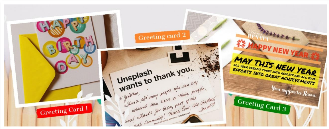
Gambar: Jenis-jenis kartu ucapan

After you learn the pictures above, give checklist (✓) in the column that suits you best!