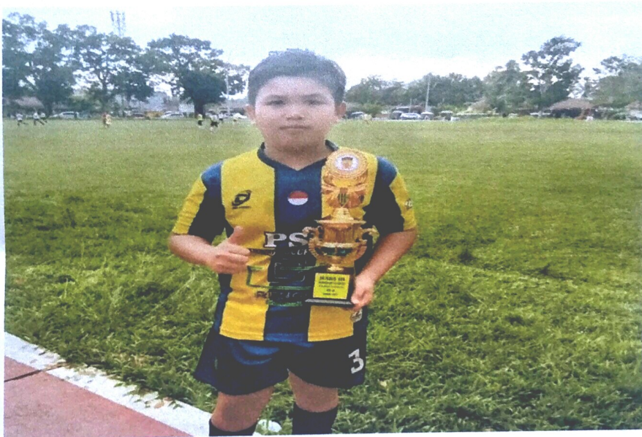
Gambar 2. Example of Descriptive Text