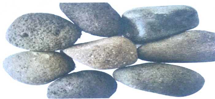
Gambar 1 . Stones