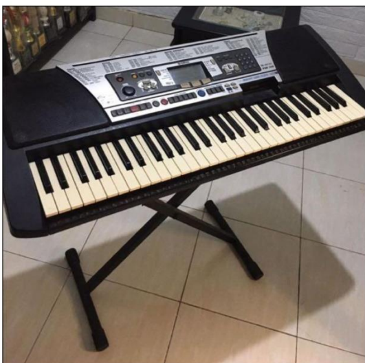
Alat Musik Keyboard