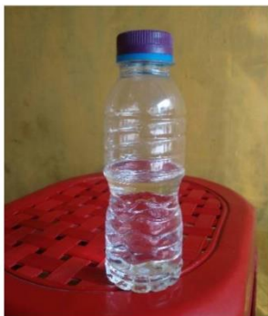
Botol Plastik Bekas