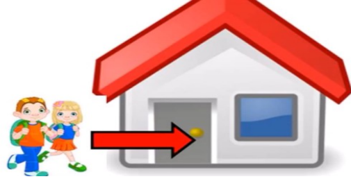
Je rentre chez moi