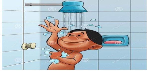
Je me lave