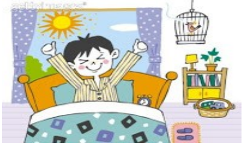
Je me lève