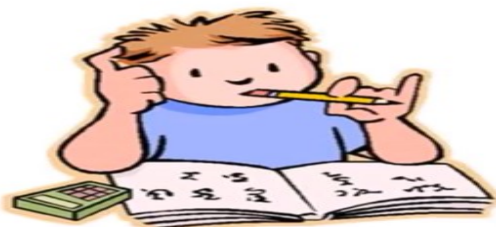
Je vais faire mes devoirs