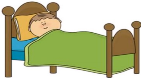
Je me couche