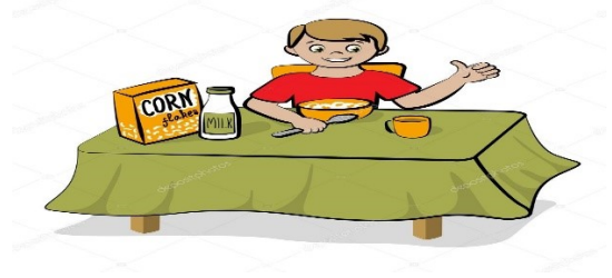
Je prends mon petit déjeuner