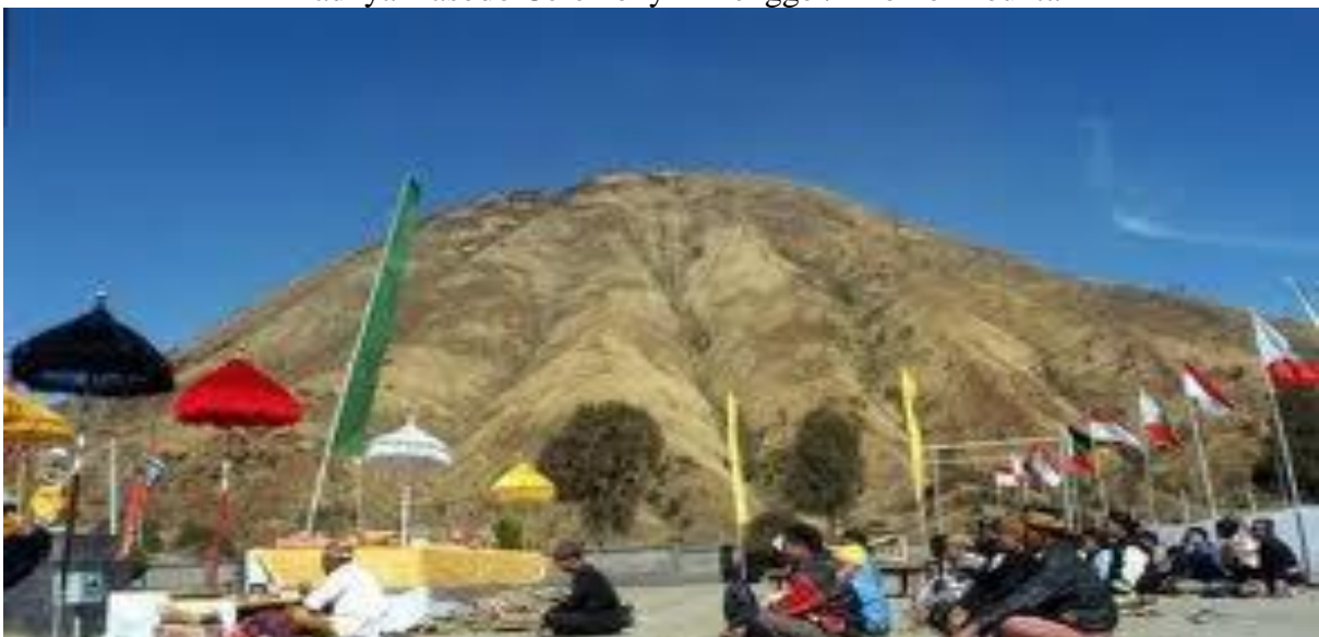
Yadnya Kasodo Ceremony in Tengger/ Bromo Mountain