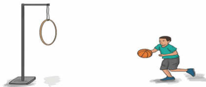
Gambar 1.12 Dribling dan shooting dengan simpai