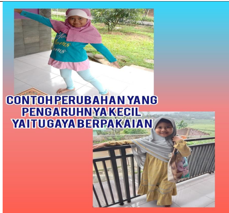
Gambar 2. Contoh Bentuk Perubahan Sosial Budaya yang Pengaruhnya Kecil.