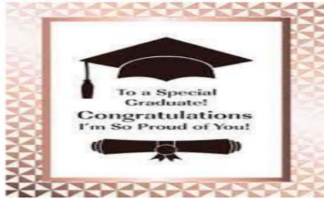
Gambar 4 https://www.holidaycardsapp.com/cards