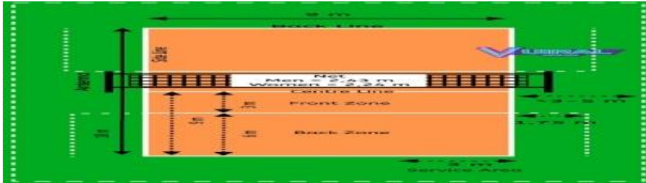
Gambar lapangan Voly