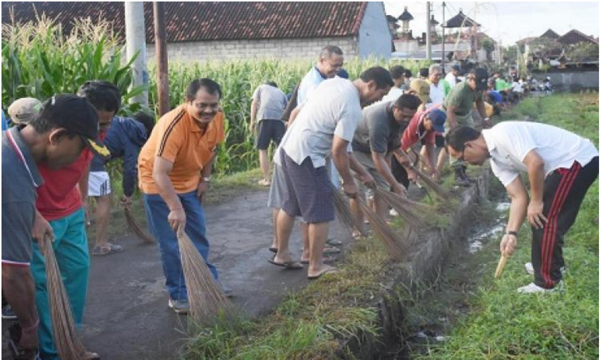
Gambar gotong royong