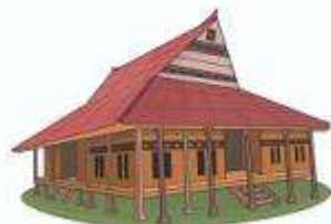
Baileo (Rumah Adat Provinsi Maluku)