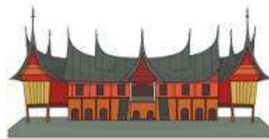
Rumah Gadang (Rumah Adat Sumatera Barat/Sumbar)

Bentuk rumah adat suatu daerah sesuai dengan kondisi alam dan kondisi sosial masyarakatnya. Bentuk rumah adat menunjukkan ciri khas kehidupan masyarakat di setiap daerah.