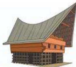
Rumah Balai Batak Toba (Rumah Adat Sumatera Utara/ Sumut)