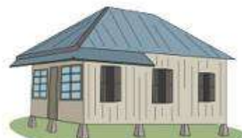
Rumah Adat Bangka Belitung