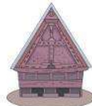
Rumah Aceh (Rumah Adat Nanggroe Aceh Darussalam)