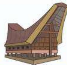
Rumah Adat Tongkonan (Rumah Adat Provinsi Sulawesi Selatan/ Sulsel/Suku Toraja)