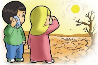
Ilustrasi :Rachman ebookanak.com