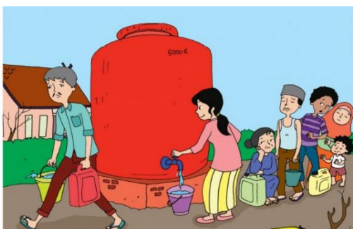
Gambar 1. Kekurangan air bersih

A. Amatilah dua gambar kejadian yang terjadi pada musim kemarau dan penghujan berikut ini !