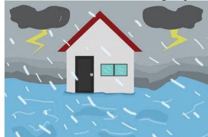
Ilustrasi waspada banjir.