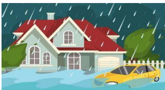
Gambar 2. Hujan dan angin kencang