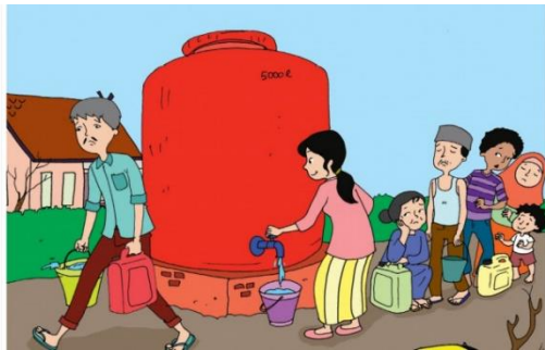
Gambar 1. Kekurangan air bersih