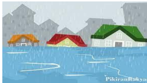
Gambar 2. Banjir saat terjadi hujan