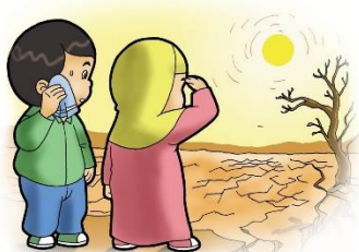
Ilustrasi :Rachman ebookanak.com