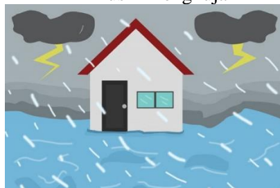
Ilustrasi waspada banjir.