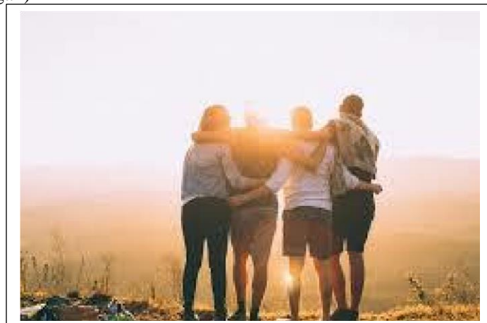
Gambar tanpa caption yang akan dilengkapi siswa