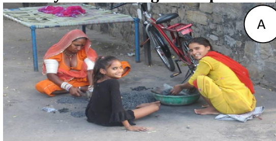
Smiling faces greet us on the streets of Bangalore!

Identify the meaning of the photo Caption below.