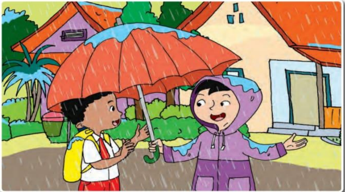
GAMBAR MUSIM PENGHUJAN