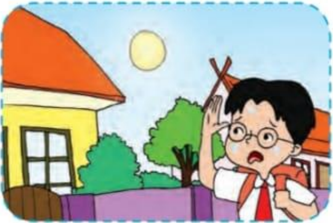
GAMBAR MUSIM KEMARAU