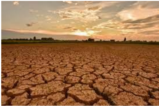
Gambar menghadapi musim kemarau