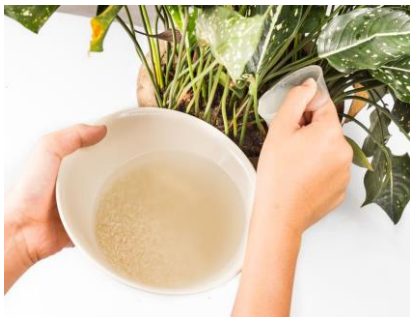
Menyiram tanaman menggunakan air beras