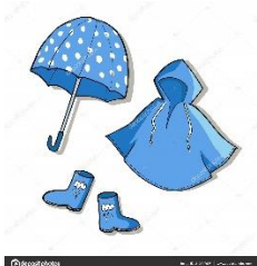
Perlengkapan Ketika Hujan