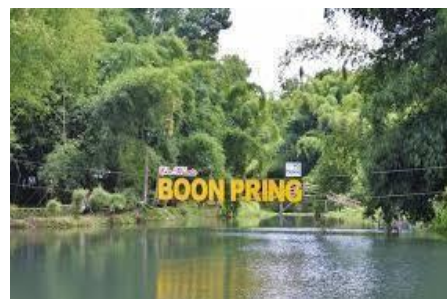
Membuat Hutan Bambu