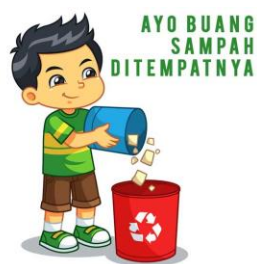
Menjaga kebersihan lingkungan