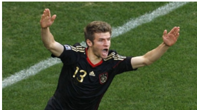
THOMAS MÜLLER aus Deutschland in München Fußballspieler