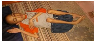
( b )