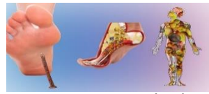
( c )