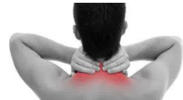
( d )