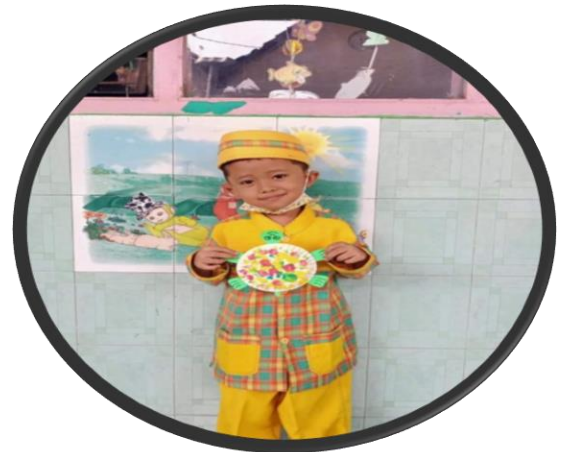
AHMAD BSB (Berkembang sangat baik)