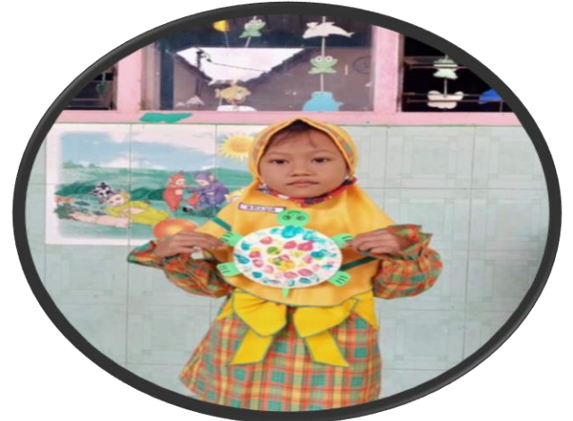
BELVA BSH(Berkembang sesuai harapan)