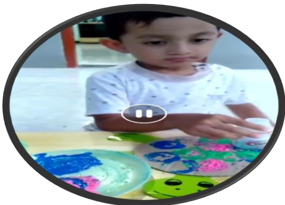
DHAVI MB(Mulai berkembang)