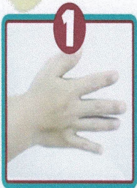
Gosok kedua telapak tangan