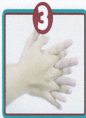
Gosok sela - sela tangan