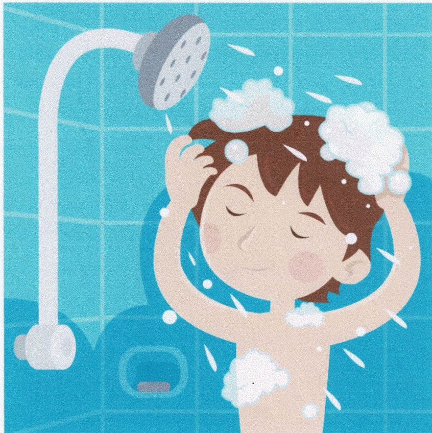
Gambar 3 membersihkan rambut