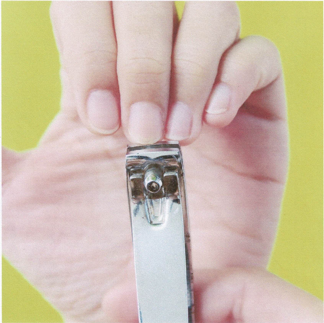
Gambar 1 pemotong kuku