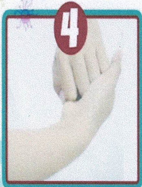
Posisi kunci tangan