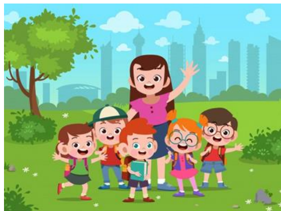
GAMBAR NO 10