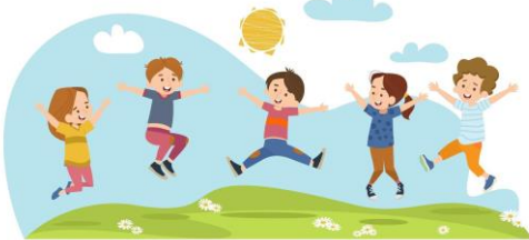
GAMBAR NO 5