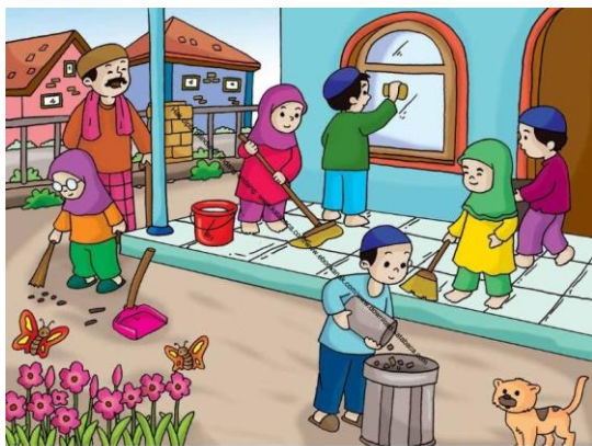
GAMBAR NO 9