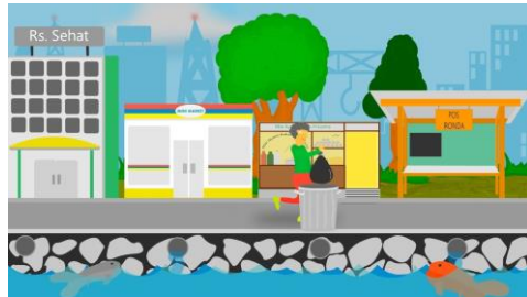
GAMBAR NO 6