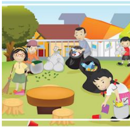
GAMBAR NO 4