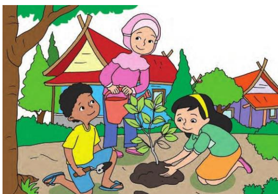
GAMBAR NO 11