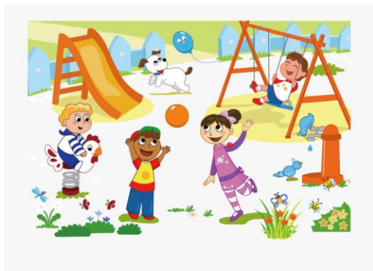
GAMBAR NO 7