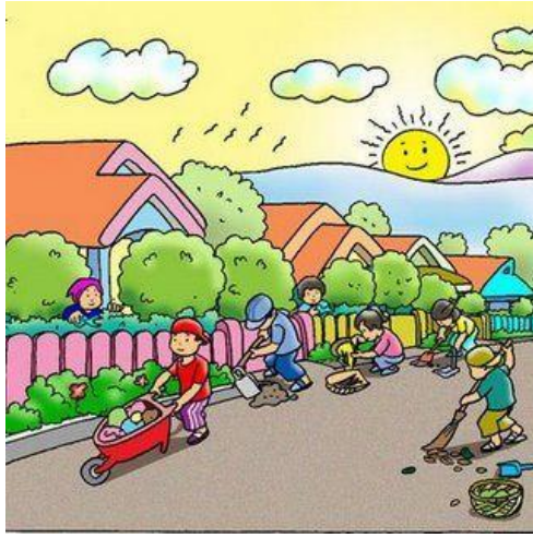
GAMBAR NO 3