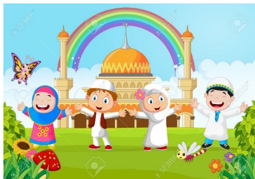
GAMBAR NO 8