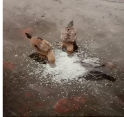
2. AYAM KECIL