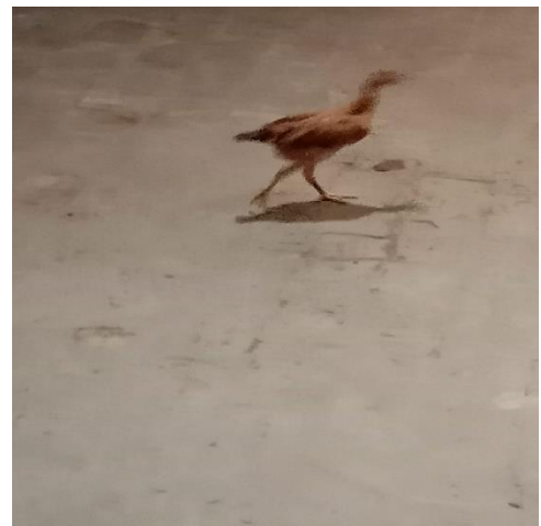
3. AYAM MUDA