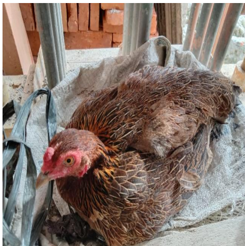
4. AYAM DEWASA