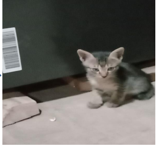
2. Kucing muda