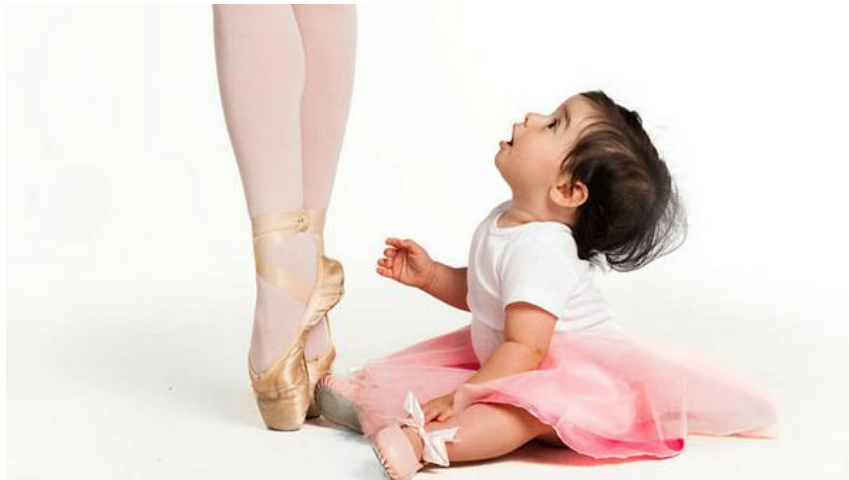
Role model

Eits , tapi kamu harus dapat membedakan ya antara iri yang membangun atau hanya iri yang ingin menjatuhkan. So , kendalikan rasa iri untuk menemukan passion .