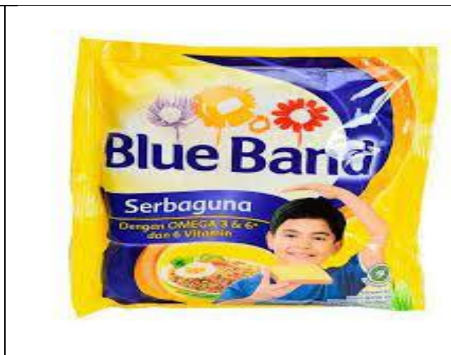
Ilustrasi bagian belakang gambar