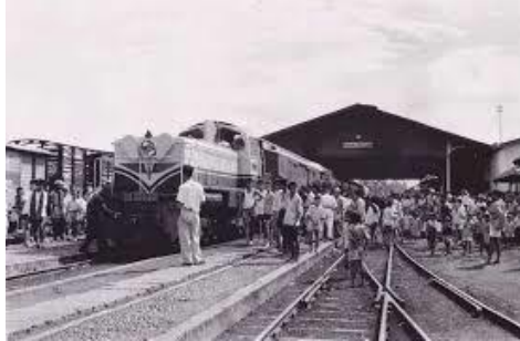
Stasiun kereta api